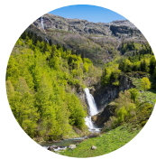
Saut deth Pish