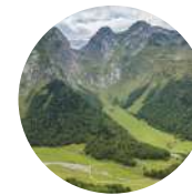
Artiga de Lin