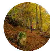
Fôret de Carlac